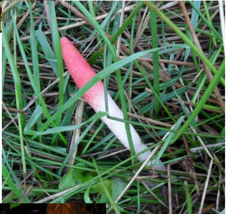
de rose stinkzwam