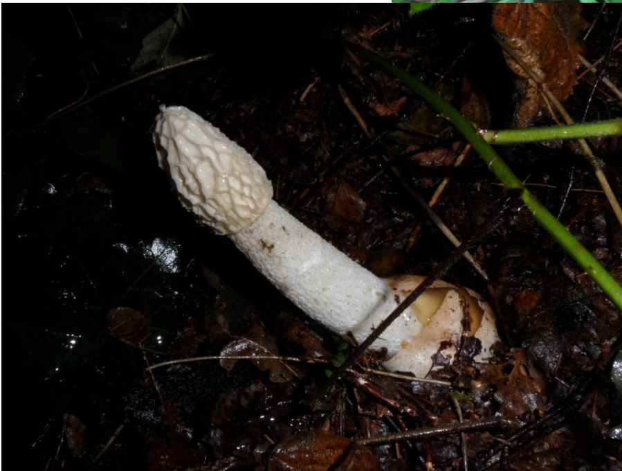
de grote stinkzwam